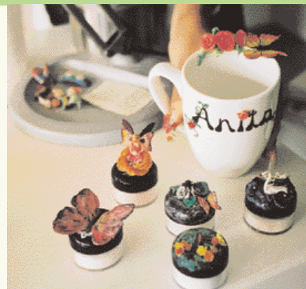
Creatief als ze is, kan Erika het niet laten om te experimenteren met decoratieve elementen.