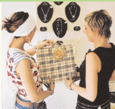
Tasjes en sieraden heeft zij ook in haar assortiment.